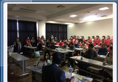
佐野女(さのめ)も多数参加して大いに盛り上がった第2分科会

第2分科会の成果 まちで学び、つながり、たまり場をつくらせて、良いまちをつくる方法